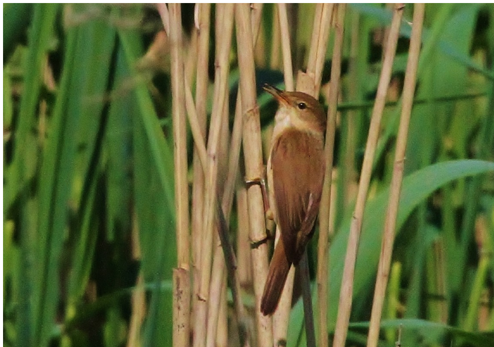
Rörsångare, en vanlig art vid Dalkarsäng